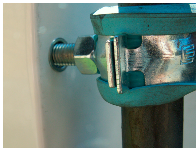
Lähikuva telineen kiinnityksestä kaappiin.

Kiinnitä mukana tulevat neljä M8-pulttia kaapin takaseinään. (Kaapissa on kierrereiät.) Kiinnitä putkikannakkeet kaapin takaseinästä ulkoneviin pultteihin. Pujota pyörötangot ja telineen suojaputkipalat paikoilleen. Suojaputket estävät telineen kiinnijuuttumisen ja näin ollen se on uudelleenkäytettävissä. Iske pyörötangot eristyksen läpi hiekkaan, kunnes asennus tuntuu tukevalta. Nosta kaappi sopivalle korkeudelle ja kiristä kannakkeet.