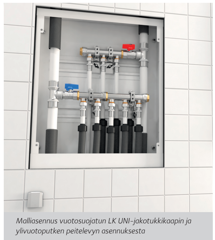
Malliasennus vuotosuojatun LK UNI-jakotukkikaapin ja ylivuotoputken peitelevyn asennuksesta

LK tarjoaa laajan valikoiman tuotteita, jotka sopivat sekä lämmitys- että käyttövesijärjestelmiin. Kaikki tuotteemme on valmistettu laadukkaista materiaaleista ja suunniteltu helpottamaan asennusta. Laajasta tuotevalikoimastamme löytyy paljon erilaisia asennusosia, lisätarvikkeita ja työkaluja. Tuotteistamme lisää nettisivuillamme www.lksystems.fi